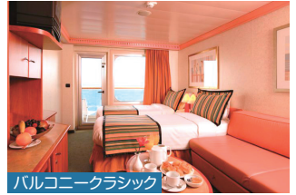
バルコニークラシック