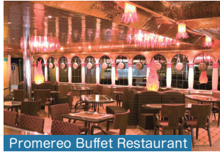
Promereo Buffet Restaurant