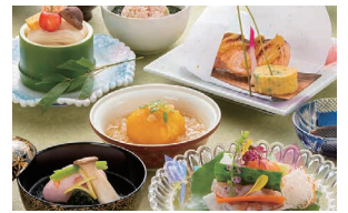
城山ガーデンズ 水簾