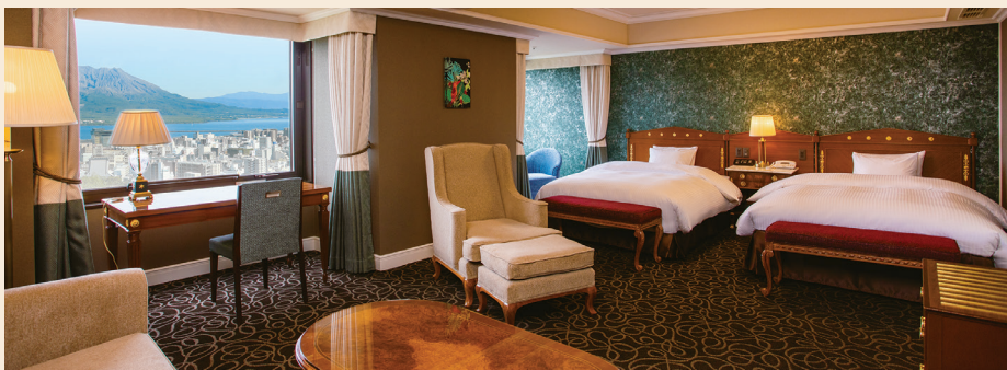
プレミアムツイン【53㎡】 ゆとりの広さを確保し、ジオリゾートエレガンスをテーマに自然をイメージしたインテリア。トリプル利用もでき、ファミリーでのご利用もおすすめ。

ホテルの上層階を中心とした桜島ビューの客室が2022年3月11日にリニューアル工事を終え、「桜島ビュー プレミアムフロア」としてオープン。お部屋のデザインは豊かな自然との調和を考えた色彩、時間を忘れゆったりとくつろいでいただける家具の配置など上質な空間を提供します。プレミアムフロア専用の優待サービスと特別感のあるルームアメニティも充実。ワンランク上の優雅な滞在をお過ごしください。