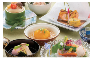
城山ガーデンズ 水簾