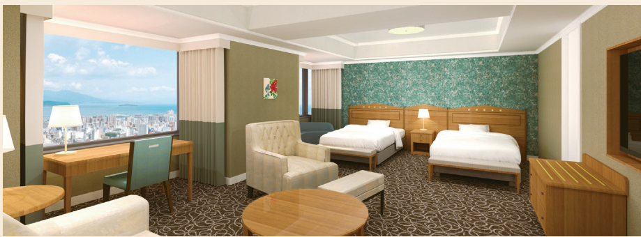
プレミアムツイン【53㎡】 ゆとりの広さを確保し、ジオリゾートエレガンスをテーマに自然をイメージしたインテリア。トリプル利用もでき、ファミリーでのご利用もおすすめ。

ホテルの上層階を中心とした桜島ビューの客室が2022年3月11日にリニューアル工事を終え、「桜島ビュープレミアムフロア」としてオープン。お部屋のデザインは豊かな自然との調和を考えた色彩、時間を忘れゆったりとくつろいでいただける家具の配置など上質な空間を提供します。プレミアムフロア専用の優待サービスと特別感のあるルームアメニティも充実。ワンランク上の優雅な滞在をお過ごしください。