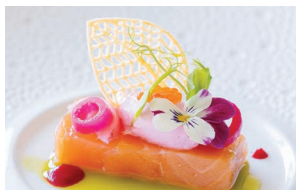
フランス料理 ルシエル