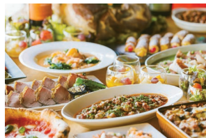
ガーデンレストラン ホルト

ガーデンレストラン ホルト 洋食ディナービュッフェ 開放的なテラス席を備えた、木のぬくもりのある上品なビュッフェレストランで、バラエティ豊かなメニューの数々をお楽しみいただけます。