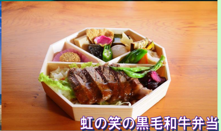
虹の笑の黒毛和牛弁当