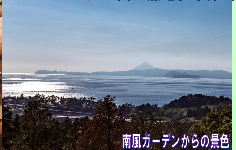
南風ガーデンからの景色